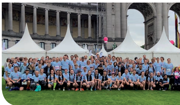
| L'équipe « Cocoon »