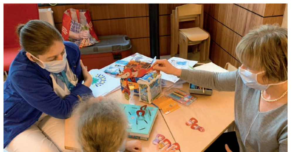
Des membres du personnel de Saint-Luc encadrent bénévolement les enfants des médecins et des soignants de l'hôpital dans la garderie « improvisée » au sein de Saint-Luc.