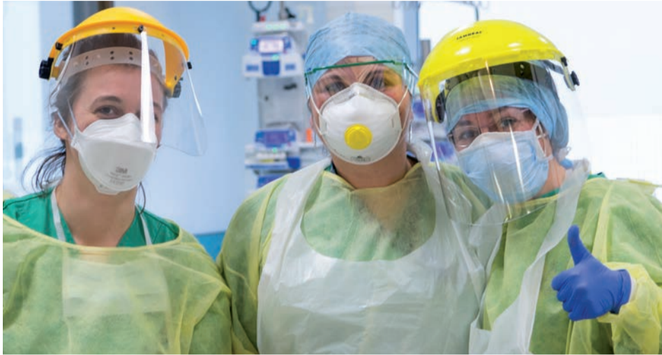
Les équipes de Saint-Luc mobilisées face à la crise du COVID-19.

Face au COVID-19, des projets de recherche sont en cours aux Cliniques universitaires Saint-Luc, et certains sont menés en partenariat avec l'UCLouvain. Le but de ces travaux est de mieux comprendre ce qui se passe actuellement, mais aussi et surtout d'obtenir des clés, des outils afin de pouvoir faire face à une éventuelle seconde vague du virus ou à l'émergence d'un nouveau coronavirus, et de toujours mieux prendre en charge les patients. Certaines études produiront des résultats rapides, tandis que d'autres nécessiteront leur poursuite pendant plusieurs mois, voire des années.