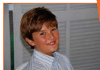
Cinq ans plus tard, le petit garçon, devenu grand, est en pleine forme.